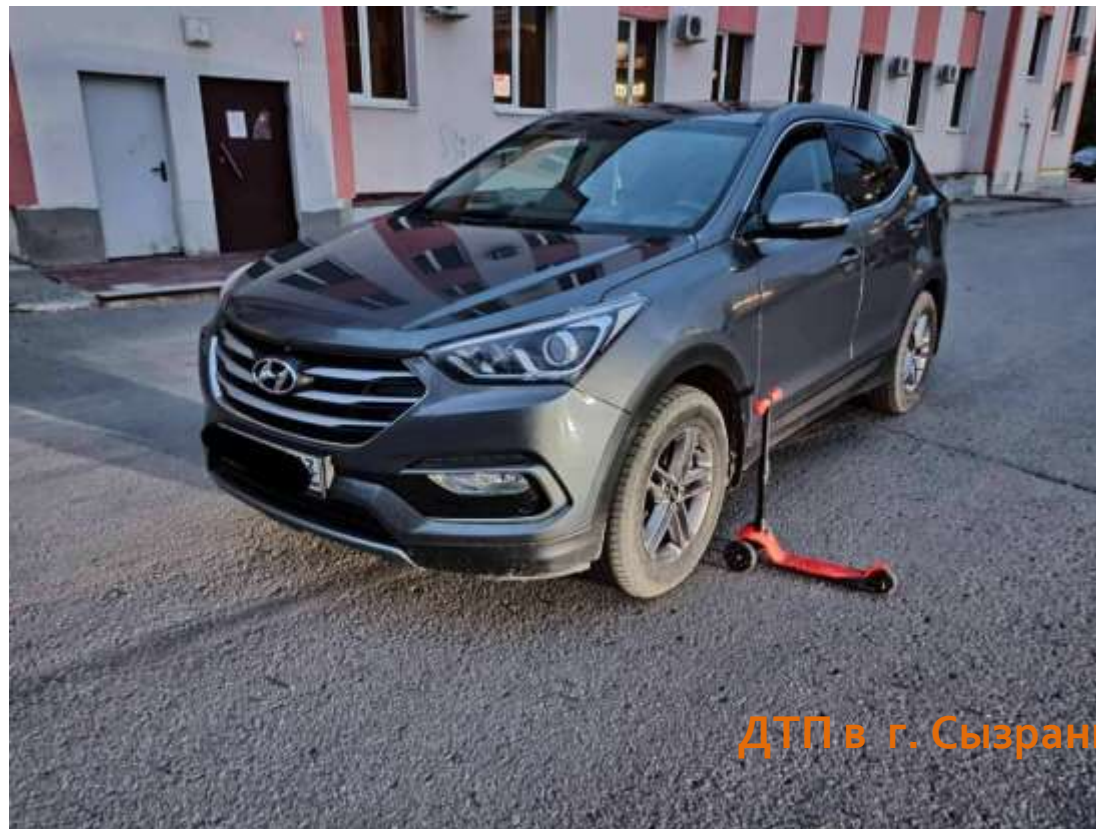
ДТП в г. Сызрань

В результате ДТП мальчику назначено амбулаторное лечение.